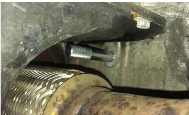
ABSTECKDORN FÜR KURBELWELLE 103627