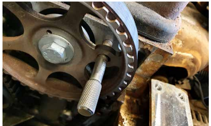
FIXIERWERKZEUG FÜR NOCKENWELLE 103614