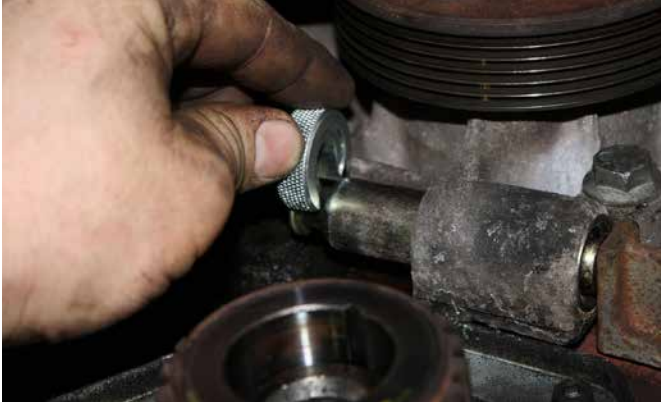
FIXIERWERKZEUG FÜR SPANNROLLE 20003