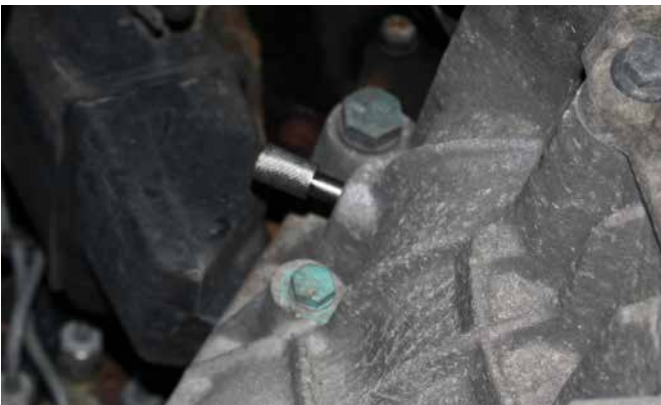
FIXIERWERKZEUG FÜR KURBELWELLE 103614