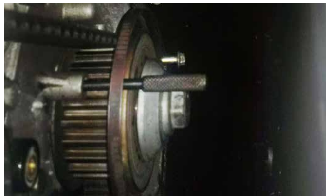
EINSTELLWERKZEUG FÜR KURBEL- / NOCKENWELLE, EINSPRITZPUMPE KT10032