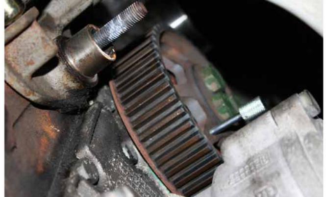
KURBELWELLEN FIXIERDORN KT10032